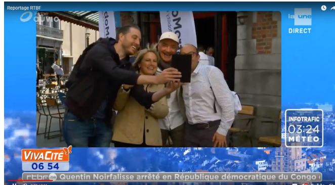
Reportage de la RTBF pendant le Maestromobile https://vimeo.com/262042674