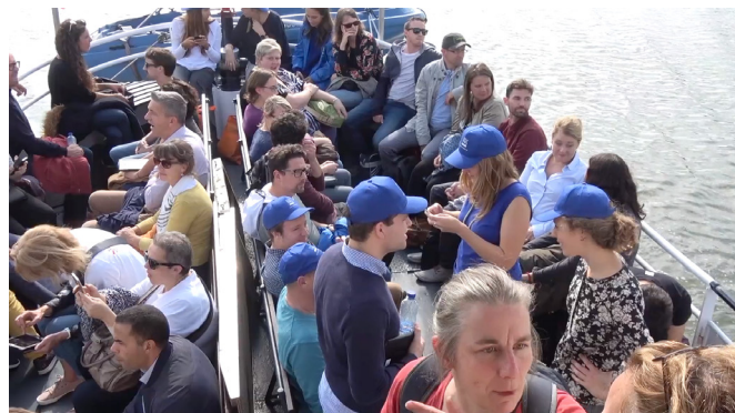
City Game en image https://vimeo.com/262042550