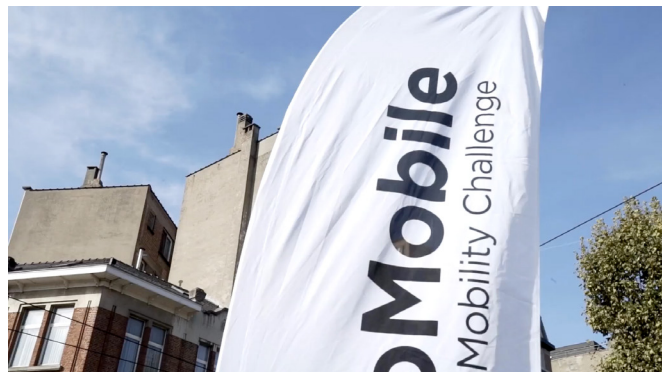
Reportage de la SNCB https://vimeo.com/294610261